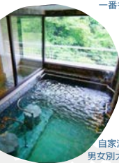
自家源泉100%の温泉 男女別大浴場、半露天風呂