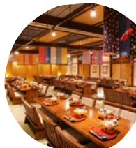
豊ダイニング宴会一例 最大120名まで可能