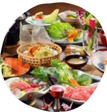
1泊2食付き 一番人気の「鬼怒太御膳」一例