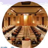
和室一例 和室の場合は最大160名まで可能